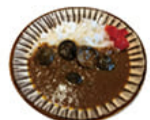
豊後 きのかカレー 810円 ぷりっぷりの小粒どんこをそのまま野菜とじっくり煮込みました。