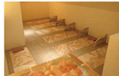
アロマソルトスパ(岩盤浴) 大理石の床と岩盤壁から発する輻射熱、アロマの香りが全身をつつまます。