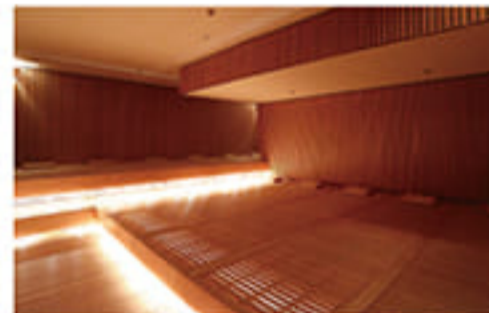
グランドロウリュ(中温ドライサウナ) 室温60℃のサウナでゆったり寛げます。