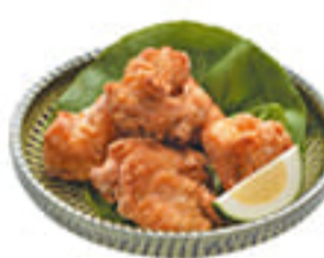
大分名物からあげ 510円 大分は鶏肉消費量日本トップクラス。揚げたてジューシーな唐揚げです。

カフェバーてんくうでは、「大分ならでは」のメニューを取り揃えています。大分にお越しのこの機会に、ぜひご賞味ください。