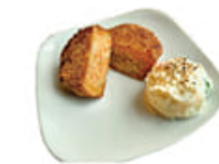
津久見特産 ぎょろっけ 350円 新鮮な魚と野菜をたっぷり入れて作った魚のコロッケです。