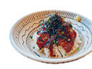
りゅうぎゅう丼 810円 魚の刺身を醤油やゴマを入れた漬け汁に浸した大分名物。