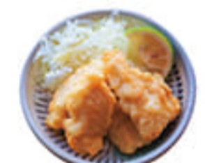
大分名物とり天 510円 鶏肉をてんぷら粉で揚げた大分のご当地料理、サクサクのとり天をどうぞ。