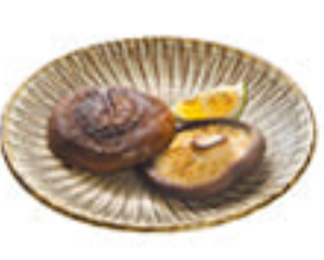
大分県産 焼きどんこ 610円 生産量全国No1のしいたけは、肉厚で香りが口いっぱい広がります。